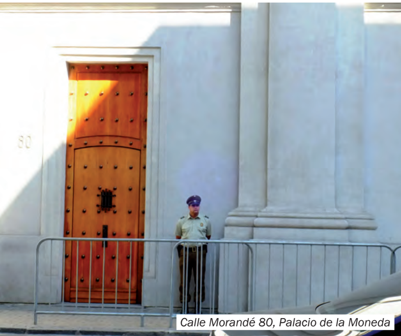
Calle Morandé 80, Palacio de la Moneda