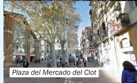
Plaza del Mercado del Clot