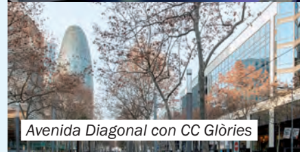
Avenida Diagonal con CC Glòries