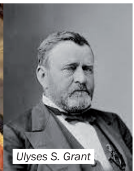
Ulyses S. Grant