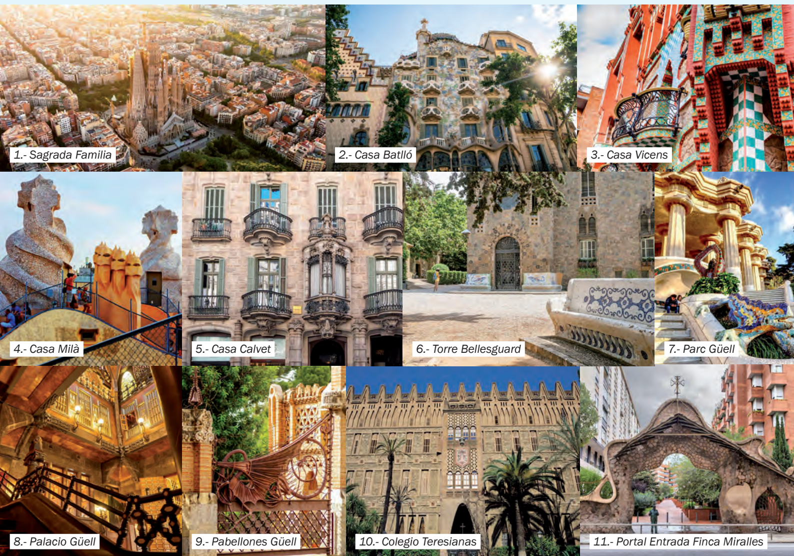
1.- Sagrada Família