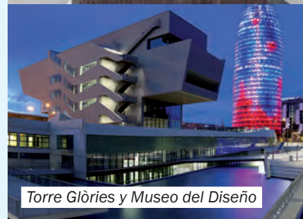
Torre Glòries y Museo del Diseño