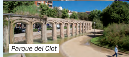
Parque del Clot