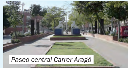
Paseo central Carrer Aragó

También os deseo mucha salud y un abrazo para todos los de Jubicam.