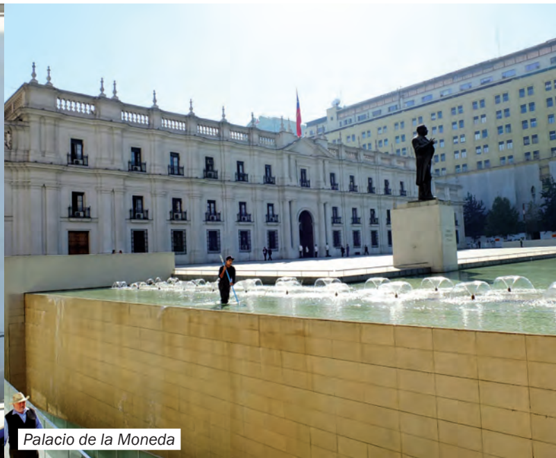
Palacio de la Moneda